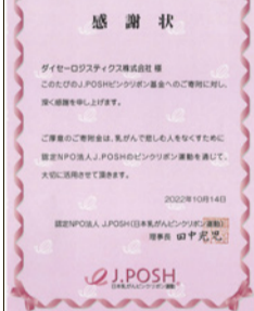
ピンクリボン基金感謝状