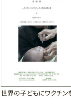
世界の子どもにワクチンを