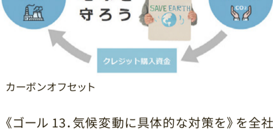
カーボンオフセット

1997年に京都で開催された地球温暖化防止京都会議(COP3)で採択された京都議定書。それに合わせて弊社では再生カートリッジにカーボンオフセット(排出権)を付与するサービスも始めました。