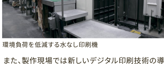
環境負荷を低減する水なし印刷機

取組を進めることで、社員の環境意識が向上し、整理整頓に努めるなど、常に環境負荷低減を意識した働き方が進んでいます。