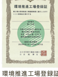
環境推進工場登録証

さらに、職場の健康づくりや環境整備にも努め、健康保険組合連合会東京連合会より健康優良企業認定証「銀の認定」を取得しました。