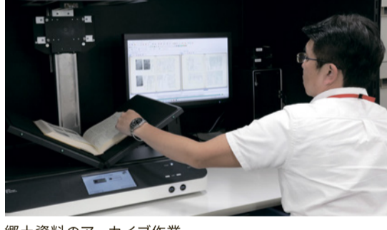
郷土資料のアーカイブ作業

文化振興の面では、アーカイブ技術を駆使して郷土資料の復刊を進め、群馬県の先人が遺した貴重な知的資源を未来に残し、活用して、地域文化の振興に寄与する取組も行っています。