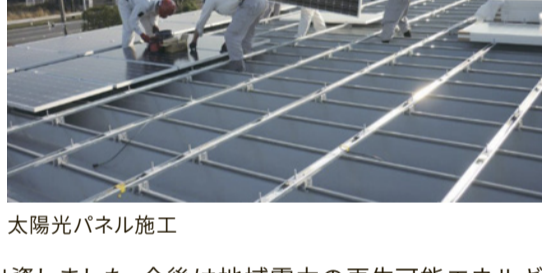
太陽光パネル施工

2022年4月、省エネコンサルである三究知(株)と共同で「一般社団法人ぐんまカーボンニュートラル推進会」を立ち上げました。6月には経済産業省の地域プラットフォーム構築事業における交付決定事業者(省エネお助け隊)に採択されました。22年度は、ほぼ計画通りの12社に対し省エネ診断を行う予定です。また22年7月、エネルギーの地産地消を目指し太陽光のPPA事業を行う「かんとくYAWARAGIエネルギー」に