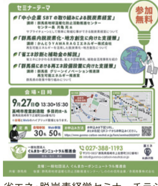
省エネ・脱炭素経営セミナーチラシ

その他のSDGsの取組として、女性活躍をビジョンに掲げ、この4年間で女性社員比率が20%から24%になり、主任職は1名から6名に、係長職は