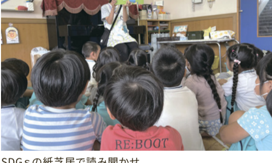
SDGsの紙芝居で読み聞かせ

昨年度からプリントをペーパーレスにしたことをきっかけにSDGsについて意識して取り組んでいます。県が行うSDGsの研修に職員が出席したり、SDGsの紙芝居を購入して読み聞かせをするなど、日々の保育の合間に意識的に子供たちにSDGsを教えていけるよう工夫しています。