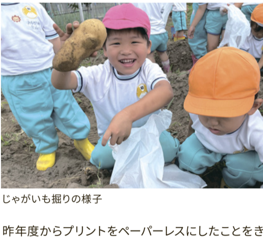
じゃがいも掘りの様子

すみよし幼稚園は「外で遊ぶ」ということを非常に大切にしており、戸外遊びの中から植物に触れ、虫に触れ、幼少期ならではの自然とのふれあいから自然の尊さを学んでいます。その中でも特にSDGsと関連が深いと感じているのは、例年地域の畑をお借りして行っているじゃがいも掘りです。認定こども園への移行に伴い完全給食となった中で、掘ったじゃがいもは給食で食べています。こうした食育活動なども積極的に行っていくことで、子供たちは日々自然のありがたみ、貧困問題について考えています。