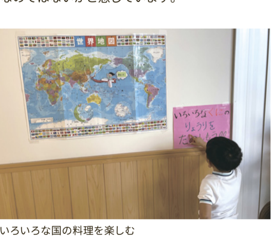
いろいろな国の料理を楽しむ

また、様々な事情から一時的にお子様を預けたいという方や、教育活動を体験したいという方に向けて一時預かりや未就園児教室なども行っています。年々ニーズが高まっている背景を見ると、子育ての面からこの地域がずっと住み続けたいまちとして皆様に思っただけのためには、これらの子育て支援活動は不可欠なのではないかと感じています。