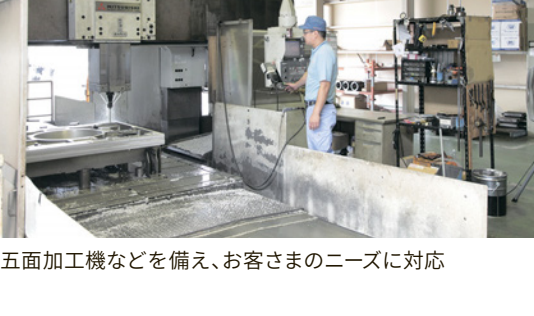
五面加工機などを備え、お客さまのニーズに対応