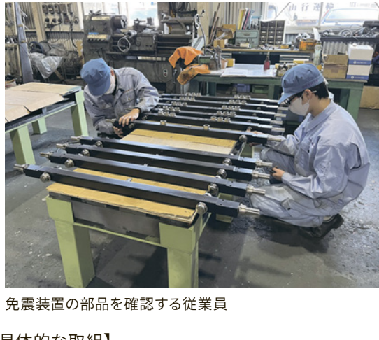
免震装置の部品を確認する従業員

地震国日本において主力の免震装置は、地震による被害を大幅に削減する防災・減災の装置です。当社の免震装置は信頼性が高いことから、官公庁舎をはじめ、電力会社の原発棟、大企業のサーバールーム、都市部高層ビル、また国宝の保護などの重要施設での採用も多くなっています。