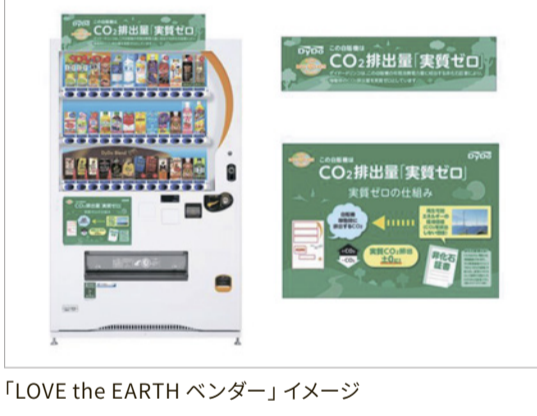
「LOVE the EARTH ベンダー」イメージ