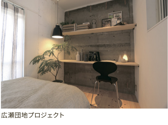
広瀬団地プロジェクト

住宅事業では県産材活用を推奨しており、県産材の床材を提案しています。前橋市の「広瀬団地プロジェクト」では前橋工科大学を中心としたチームで、老朽化した団地を大学生と再生をする「LIFORTプロジェクト」をスタート。団地の各部屋に県産材を利用し、リノベーションしました。住む学生には木の説明をして、山に興味を持ってもらえるような仕組みにしています。