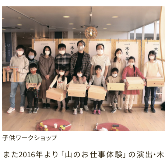
子供ワークショップ

群馬県産材を使った子供家具や木製玩具の製品開発を実施しています。「木と触れ合う、木と学ぶ、木とともに成長する」をコンセプトに「KITO (木と)」ブランドを立ち上げました。KITOの木育イベントは2019年より各店舗のイベントで毎年実施しています。木のおもちゃで遊ぶブース、木工体験ワークショップ、木が製品になるまでの過程を知る木育展示を行っています。藤岡市桜山で間伐したヒノキ材を使ったデスクや玩具は、スタイル伊勢崎店・三島家具で常設展示を行っています。