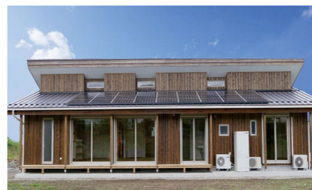
外壁材に杉の無垢材を使用 太陽光発電によるゼロエネルギー住宅や、環境に配慮した家づくり