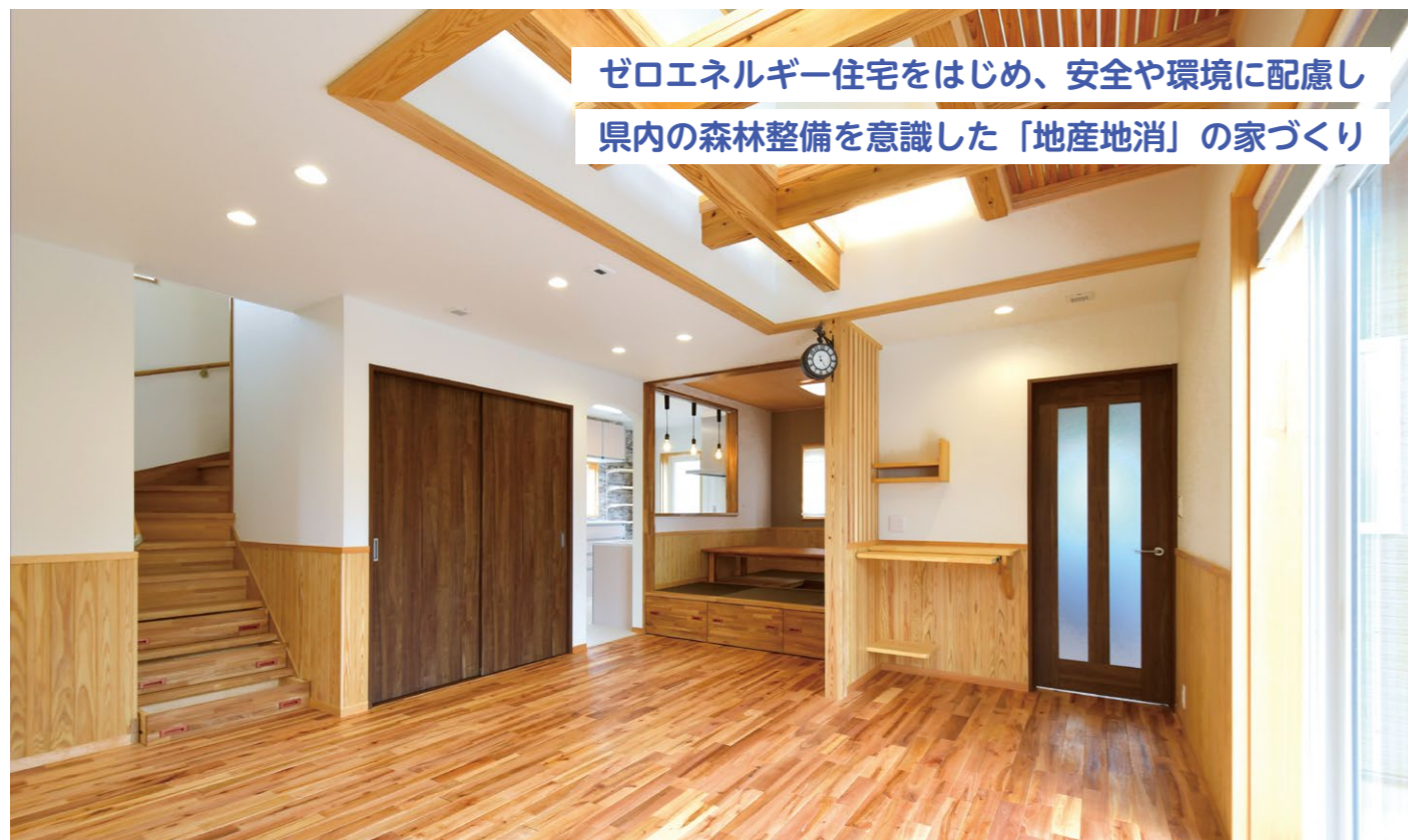
ゼロエネルギー住宅をはじめ、安全や環境に配慮し 県内の森林整備を意識した「地産地消」の家づくり