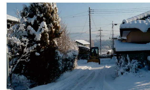
行政の除排雪が行きとどかない道路の除雪ボランティア活動